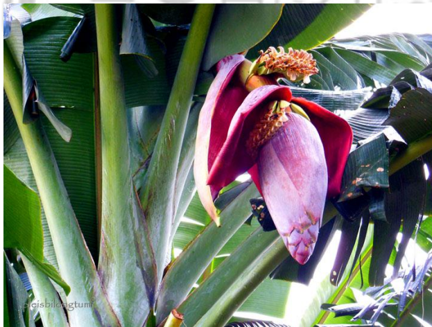
Gambar 1. Tanaman pisang kepok ( Musa Paradisiaca L.) (Dokumentasi Pribadi, 2018)