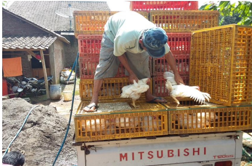
Gambar 7. Pengangkutan ayam