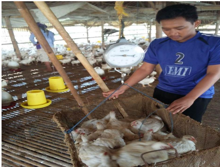
Gambar 6. Penimbangan ayam