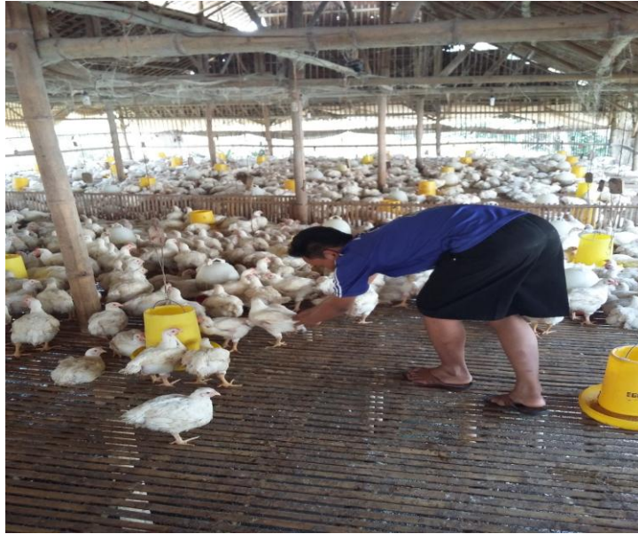
Gambar 5. Menangkap ayam saat mau di panen