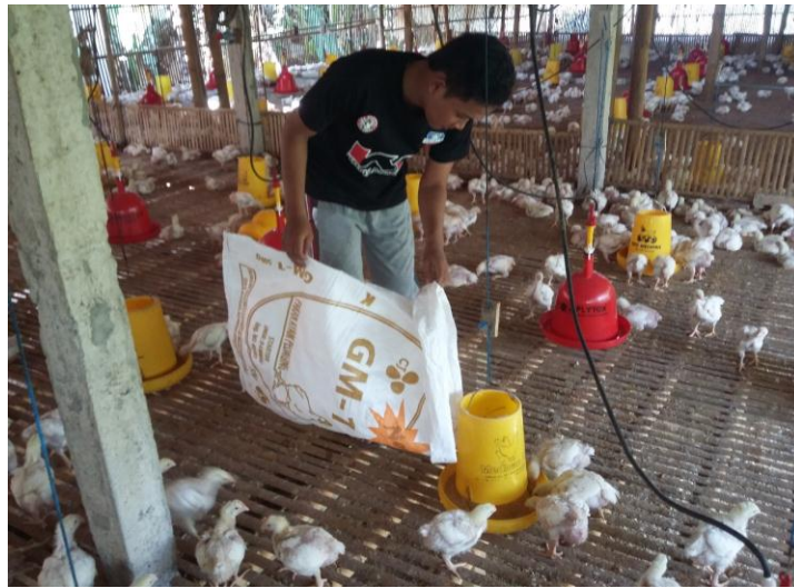
Gambar 4. Memberi makan ayam