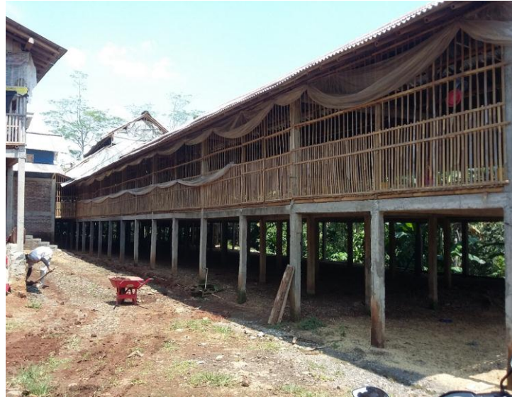
Gambar 1. Kondisi luar kandang ayam