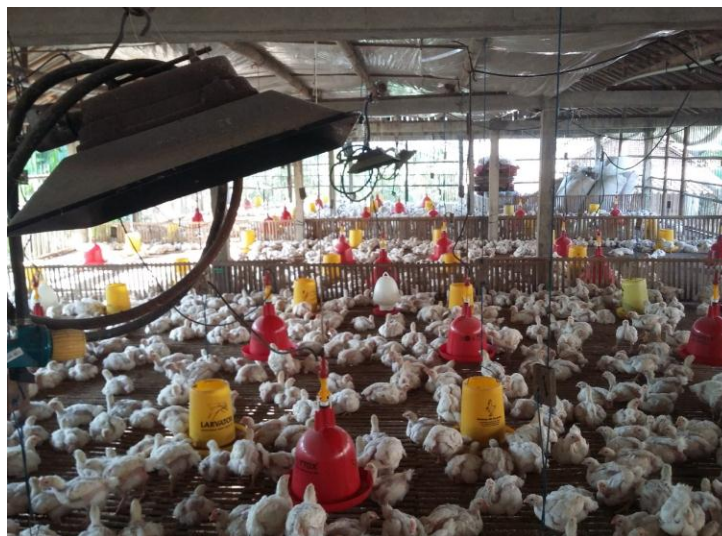
Gambar 2. Kondisi dalam kandang