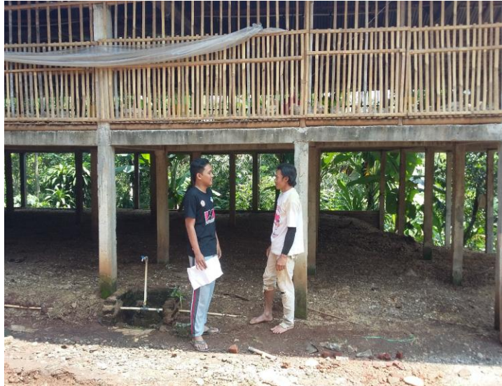
Gambar 3. Wawancara dengan peternak