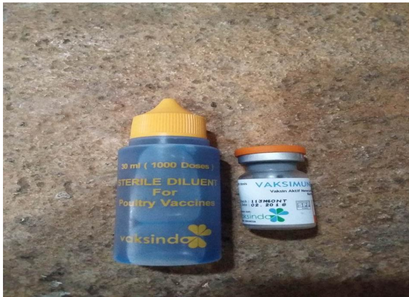
Gambar 8. Vaksin yang digunakan