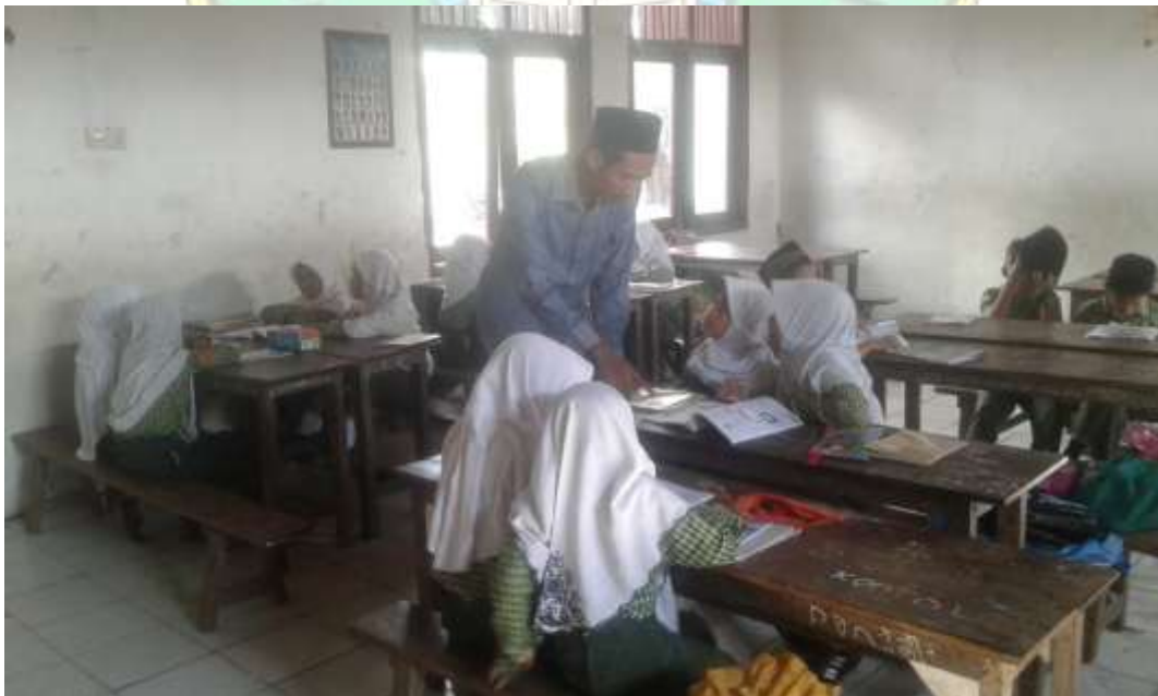
Guru sedang mengecek hasil pekerjaan kelompok sekaligus Membimbing apabila ada yang masih belum paham