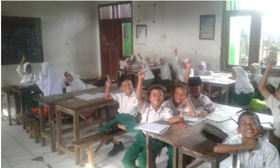
Foto Kegiatan Siklus II

Guru sedang menjelaskan materi dan setelah itu membagi kelompok dengan cara berhitung