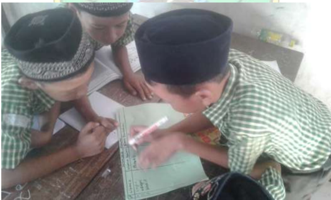
Siswa sedang menuliskan hasil kelompok pada siklus II