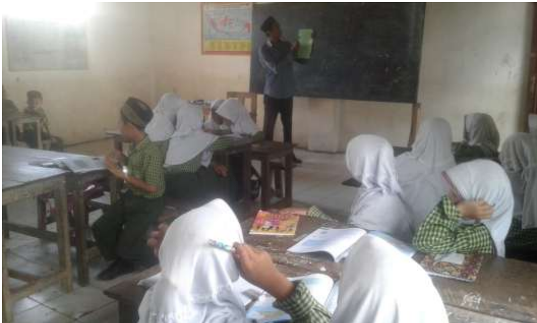
Guru sedang menjelaskan langkah-langkah Gallery Walk