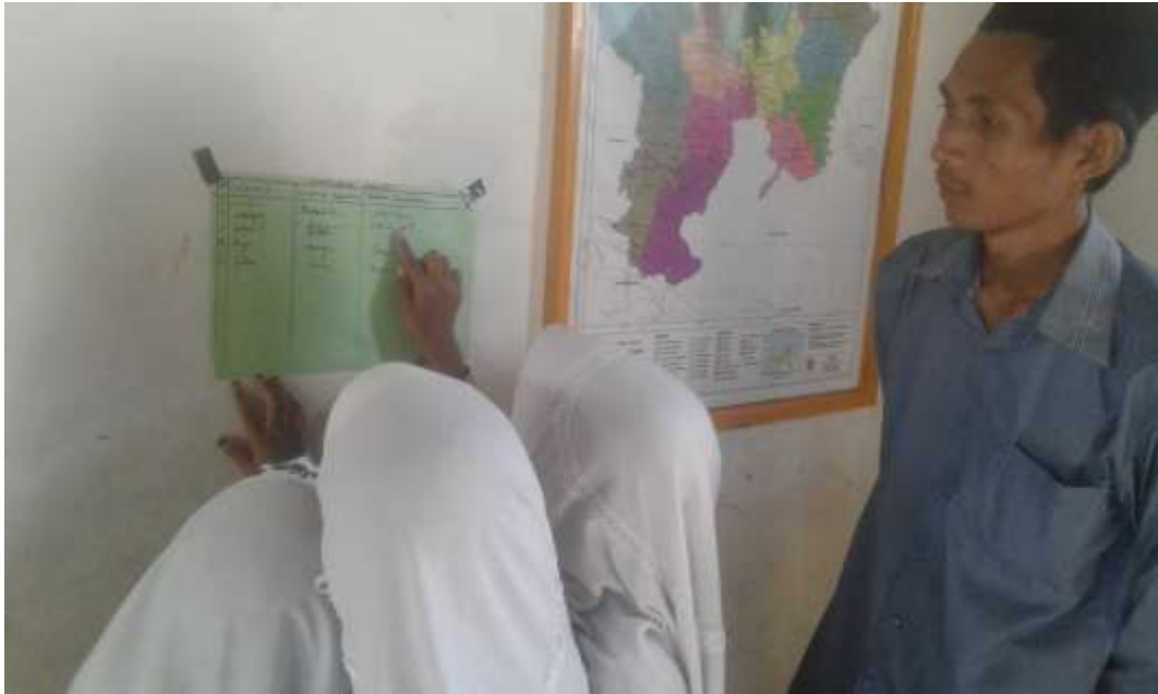
Siswa sedang meperhatikan hasil kerja kelompok lain ( Gallery Walk )