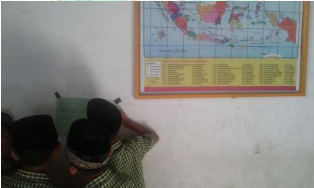
Siswa sedang meperhatikan hasil kerja kelompok lain ( Gallery Walk )