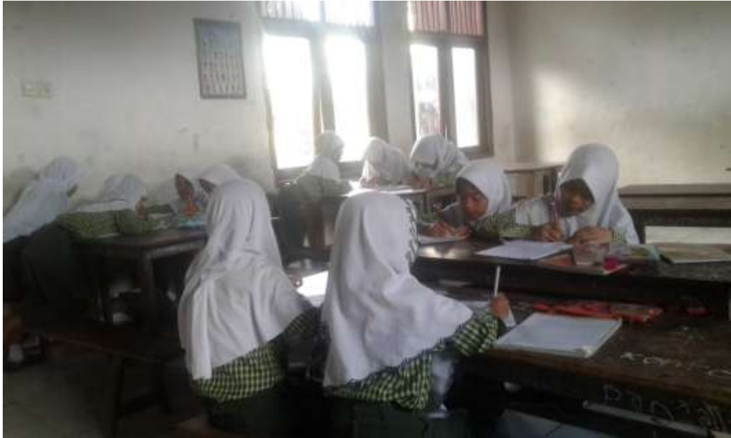
Siswa sedang bekerja kelompok