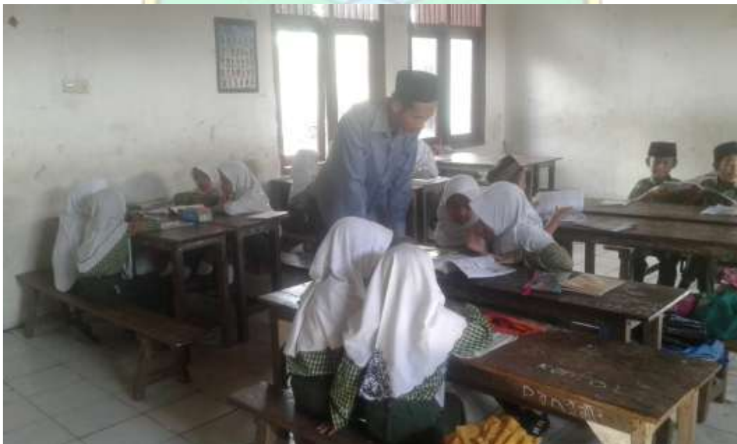
Guru sedang mengawasi jalannya kerja kelompok sekaligus mengecek hasilnya.