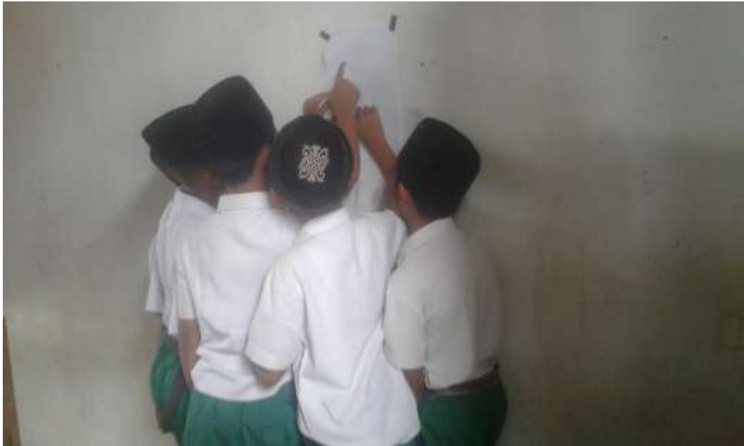
Siswa sedang melihat hasil kelompok lain secara bergiliran ( Gallery Walk )