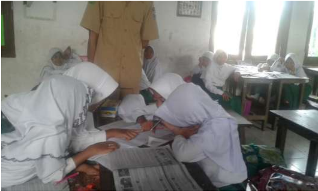
Siswa sedang bekerja kelompok pada siklus II