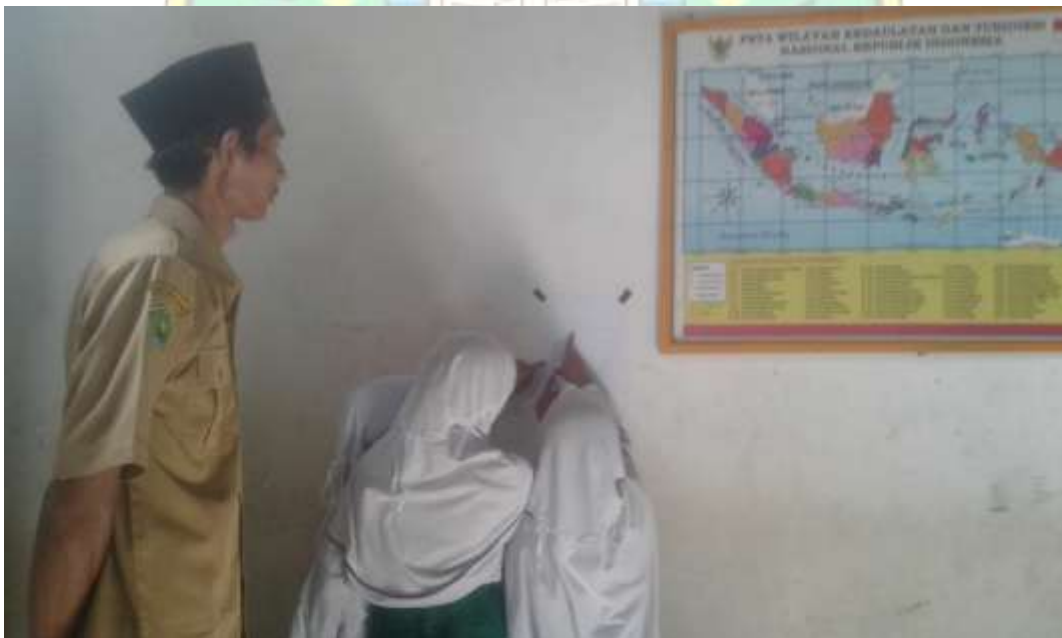
Siswa sedang melihat hasil kelompok lain secara bergiliran ( Gallery Walk )