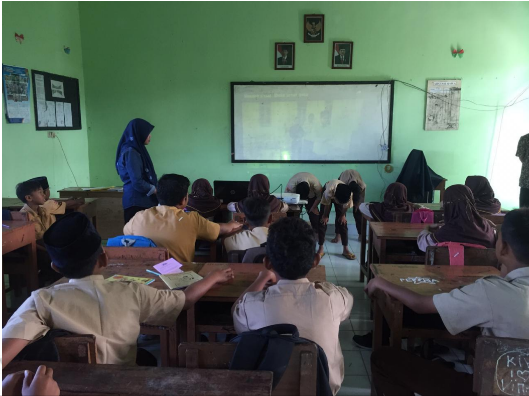
SISWA MEMPRAKTIKKAN SHALAT JAMA' DAN QASHAR