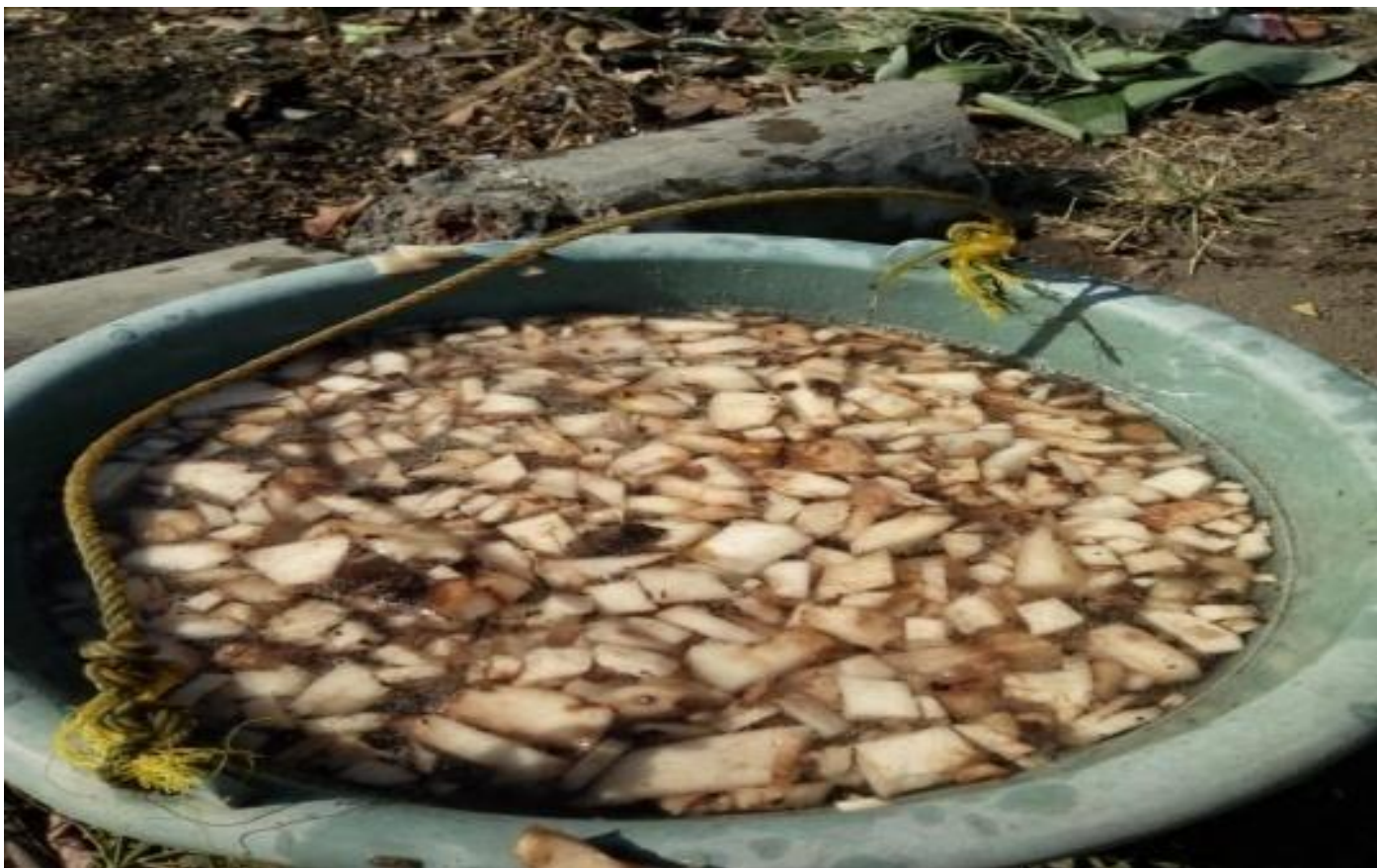
Gbr 9. Rendaman bonggol pisang dan garam krosok sebagai pengobatan pada ikan