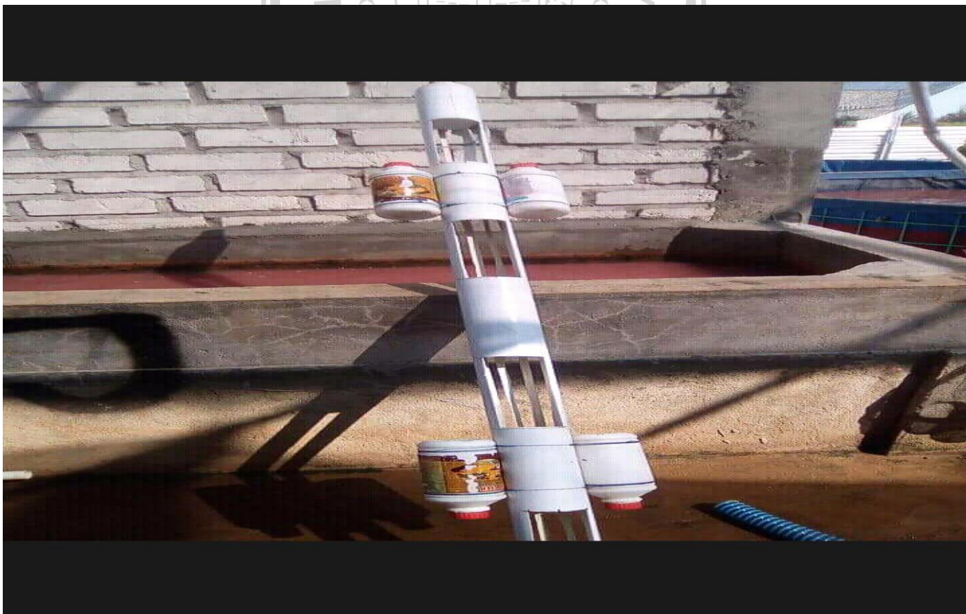
Gbr 10. Wadah Tempat Pakan Alternatif