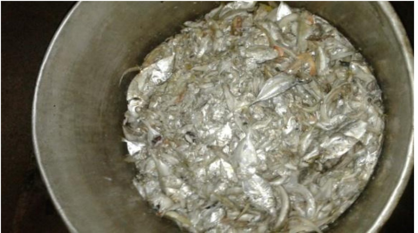
Gbr 3. Pakan alternatif yang berupa ikan rucah