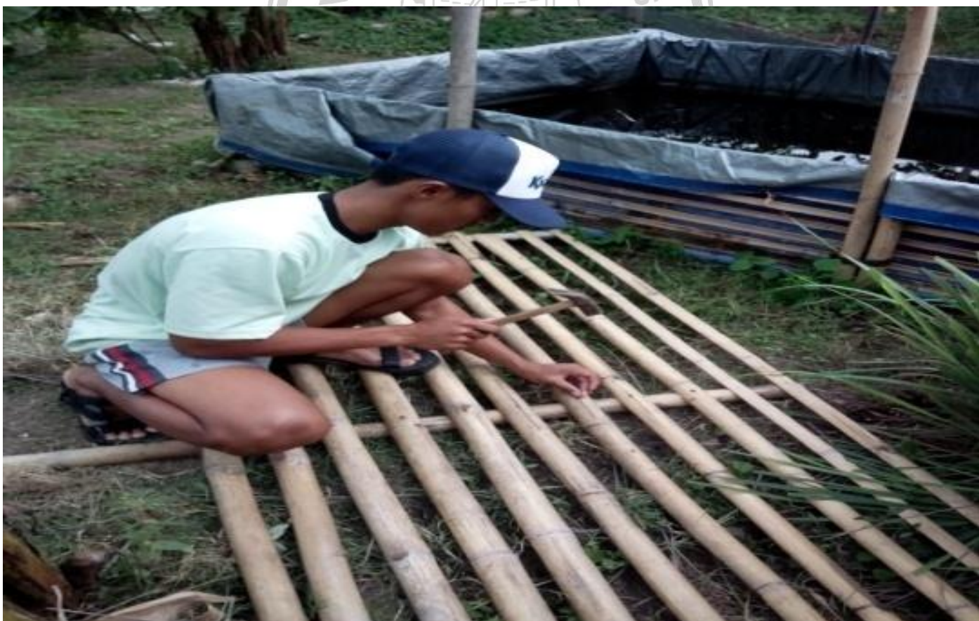
Gbr 12. Proses pembuatan rangka kolam dari bambu