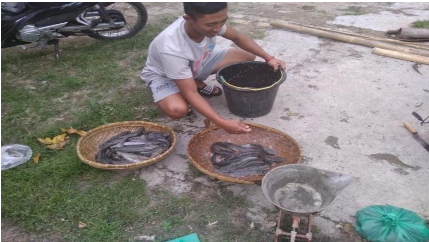
Gbr 13. Proses panen disalah satu anggota kelompok