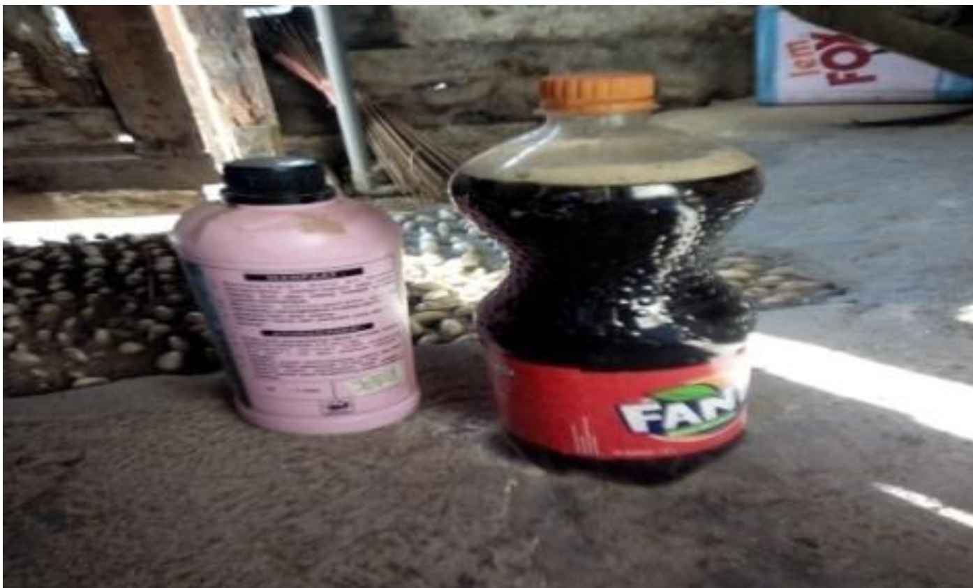
Gbr 11. EM4 dan molase sebagai bibis pakan