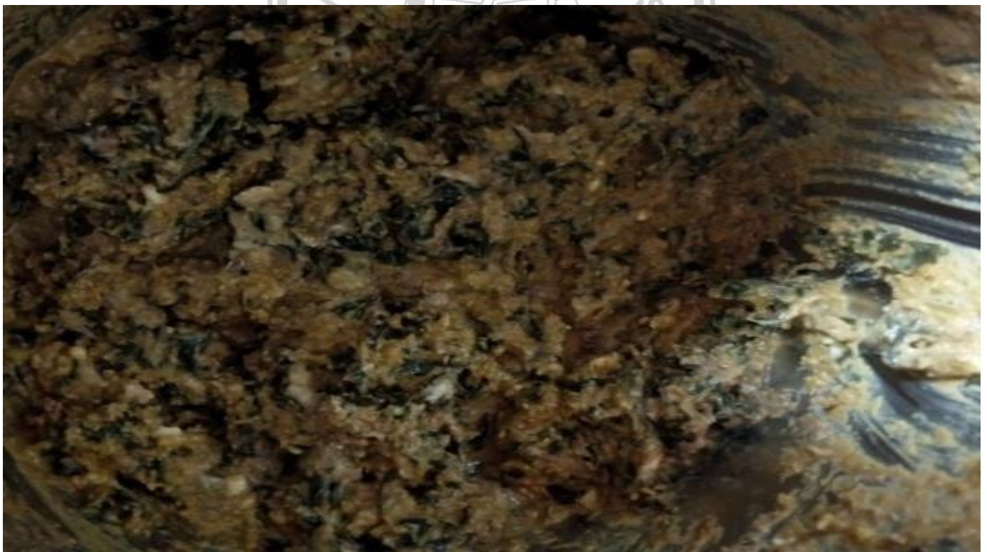
Gbr 4. Salah satu pakan alternatif pengganti, jika pakan alternatif pertama sedang mahal atau langka