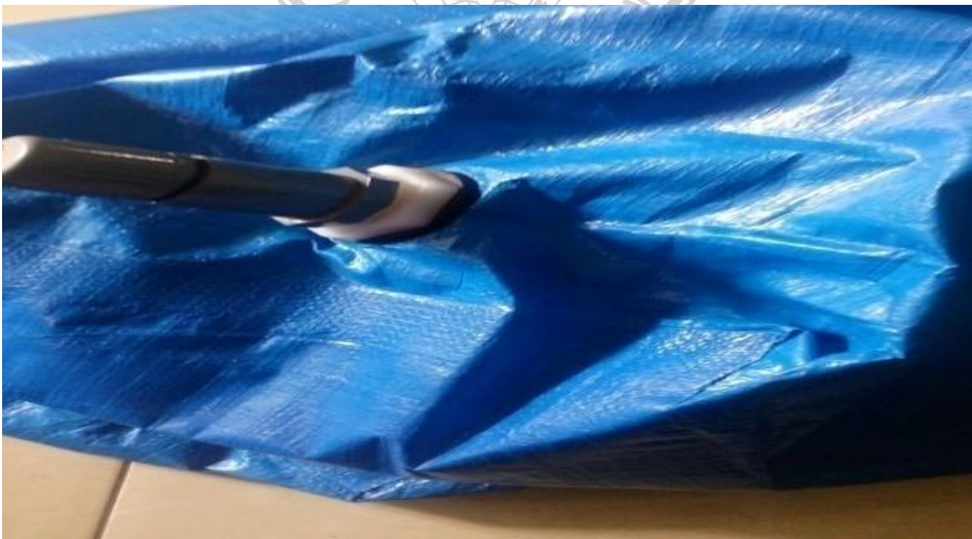
Gbr 8. Model output terbaru