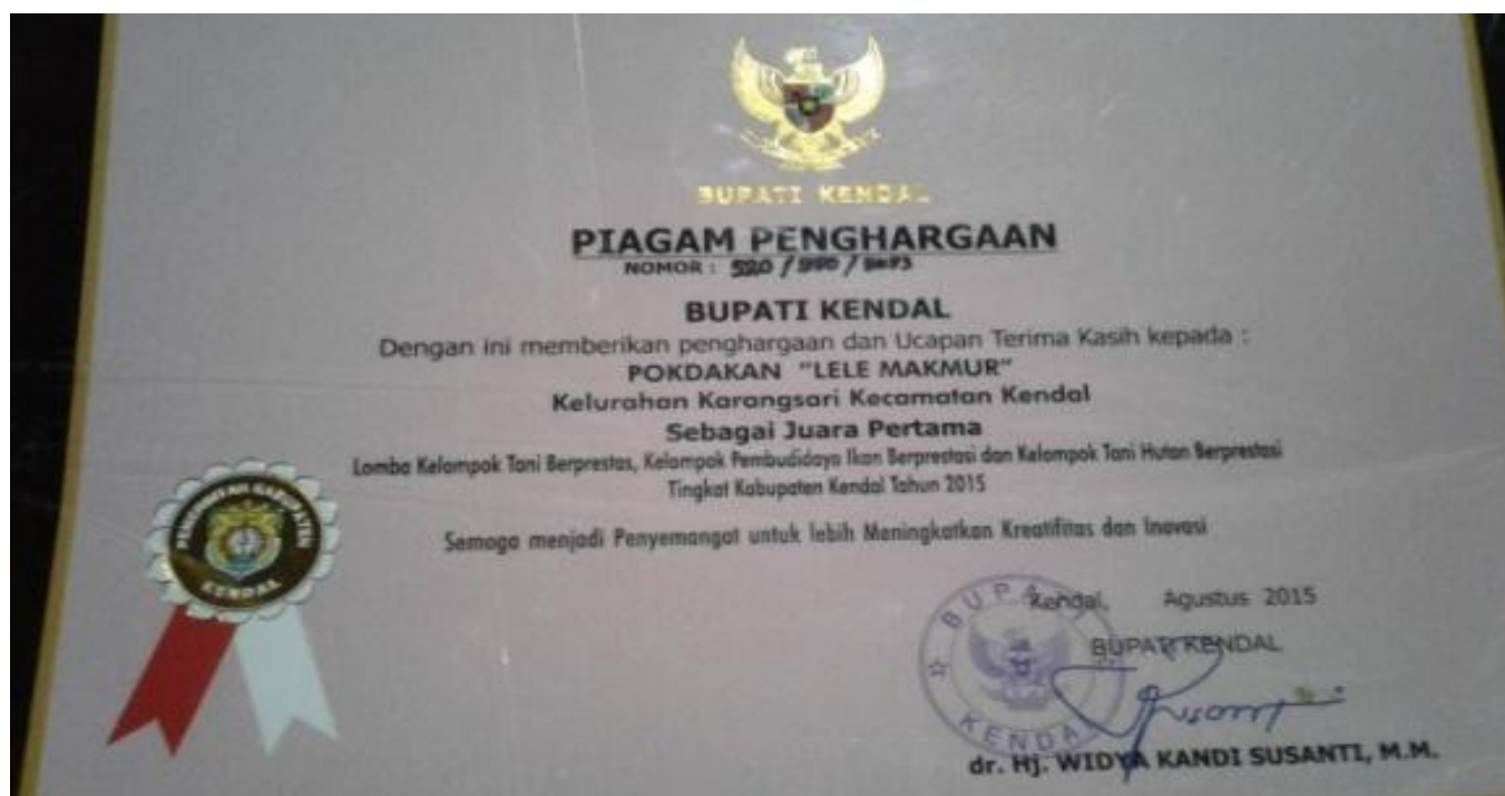
Gbr 1. Piagam Penghargaan kelompok Lele Makmur Kecamatan Kendal Kabupaten Kendal