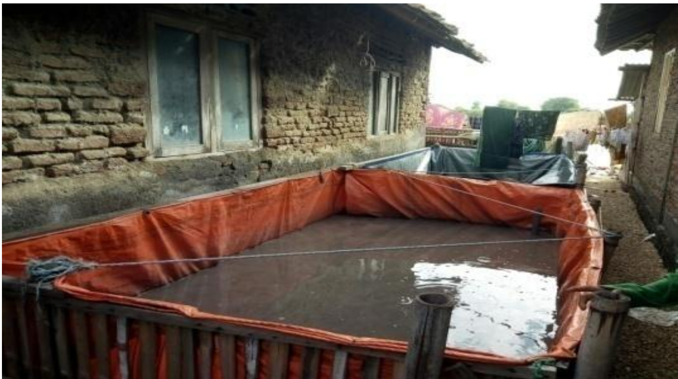
Gbr 7. Salah satu kolam pembesaran milik anggota kelompok