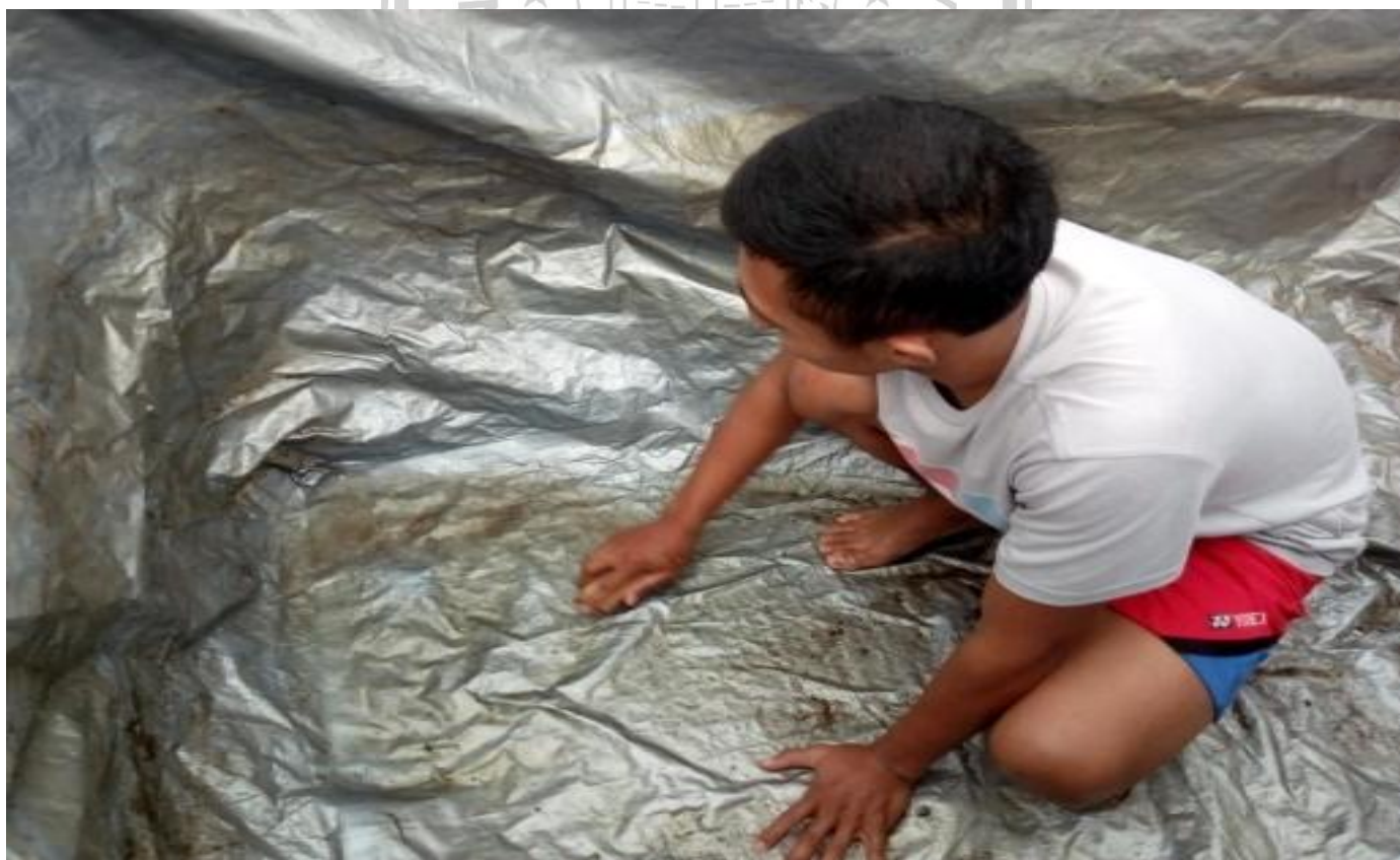
Gbr 6. Proses pembersihan kolam setelah panen berlangsung