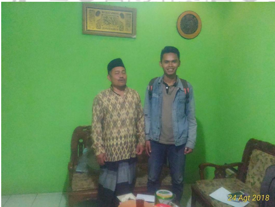
Gambar 16. Wawancara bersama pedagang besar