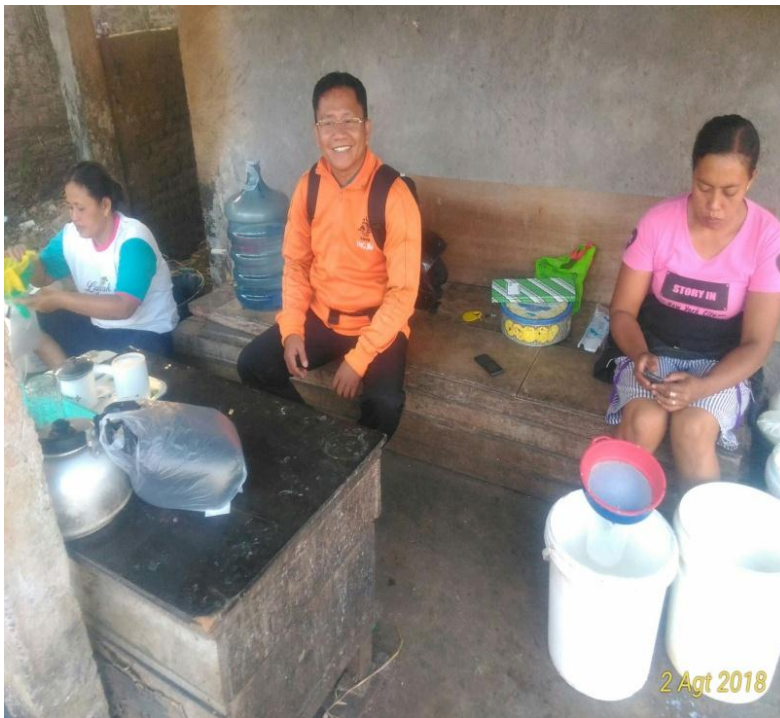
Gambar 9. Pengecer dan pengempul