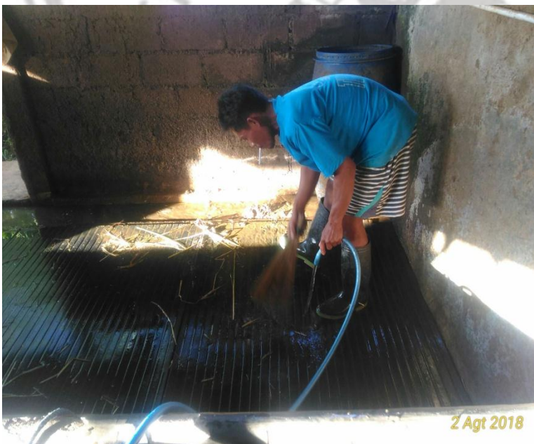
Gambar 8. Pembersihan kandang