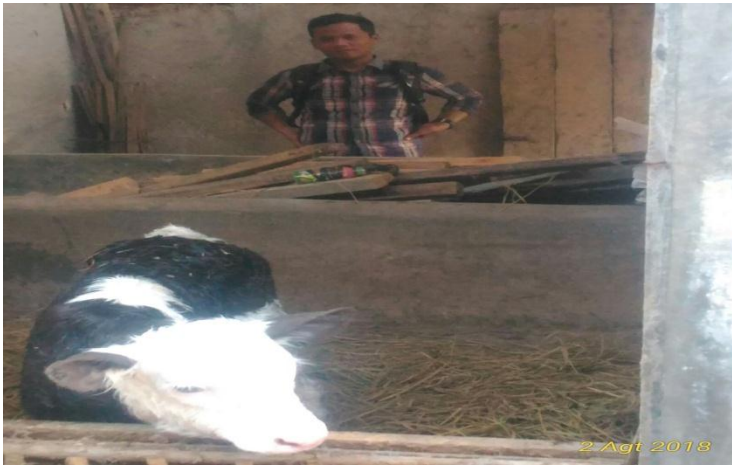
Gambar 7. Pedet jantan ( peranakan FH )