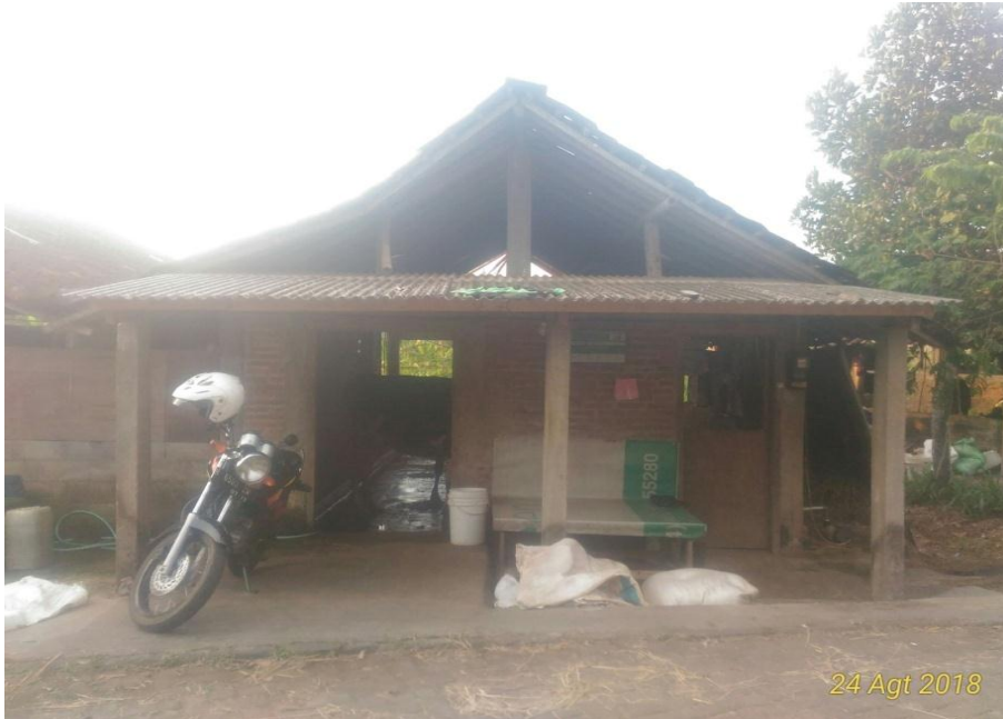
Gambar 15. Kandang Sapi