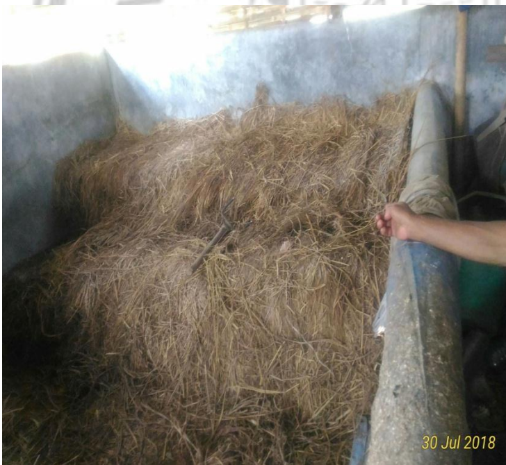
Gambar 4. Rumput