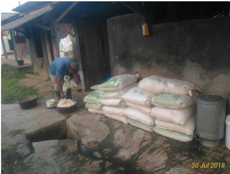
Gambar 13. Proses pencampuran ampas tahu, konsentrat dan ketela