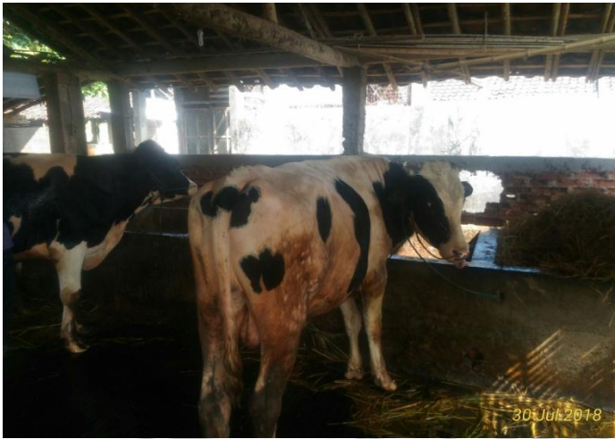
Gambar 5. Jenis Sapi Peranakan FH (PFH)