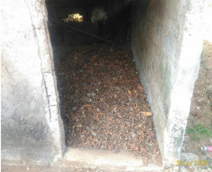
Gambar 3. Kulit Ketela