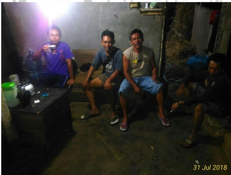
Gambar 10. Peternak sapi perah kelompok tani ternak rejeki lumintu