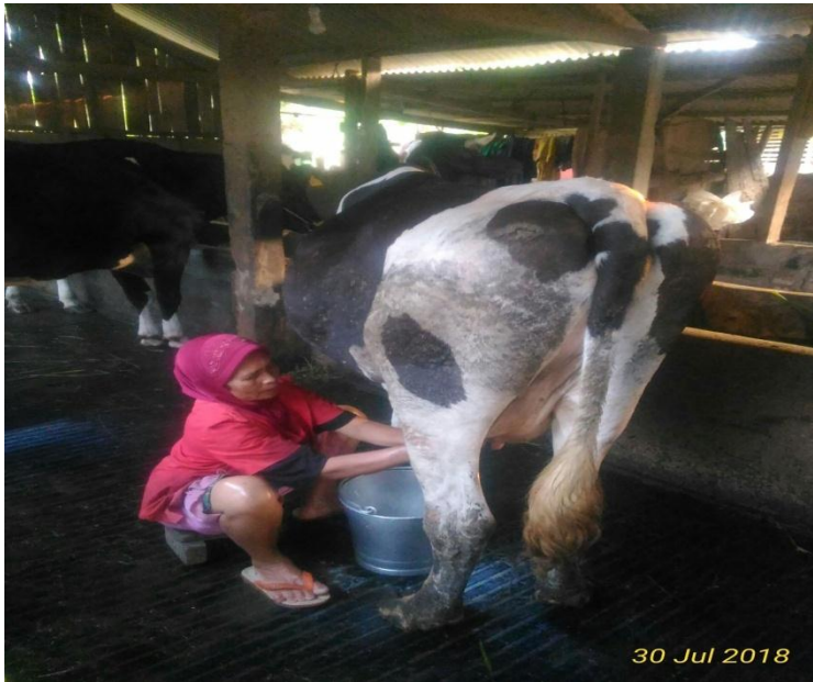
Gambar 1. Proses pemerahan susu