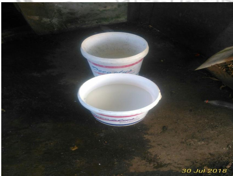
Gambar 2. Susu sapi perah