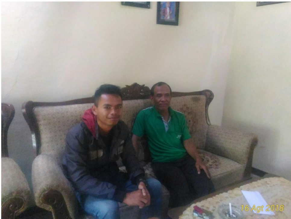
Gambar 17. Wawancara bersama ketua kelompok rejeki lumintu