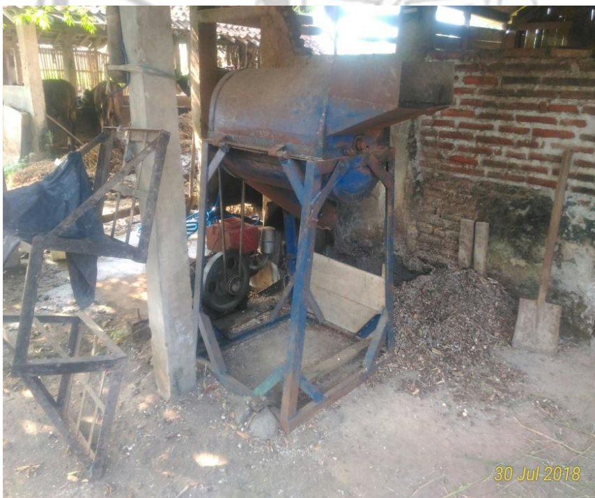
Gambar 12. Alat penggiling kulit ketela