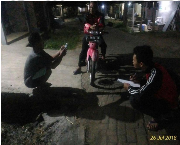
Gambar 6. Wawancara dengan peternak (Responden)