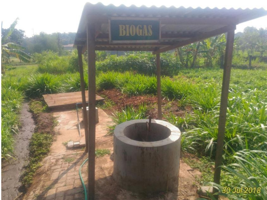
Gambar 11. Biogas