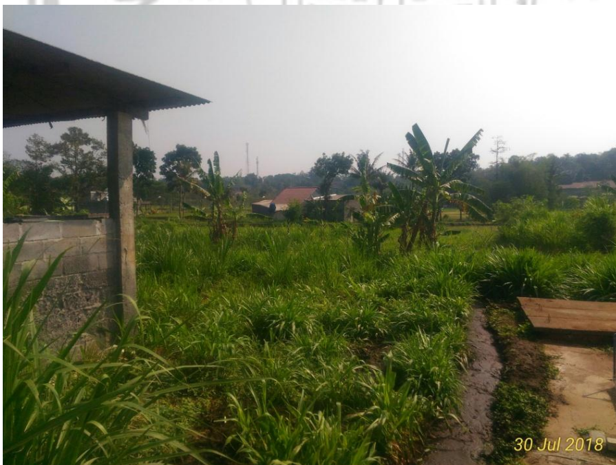
Gambar 14. Rumput atau hijauan