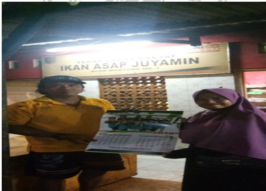
Gambar 2. Bersama Ketua Kelompok Pengolahan Ikan “Asap Indah”