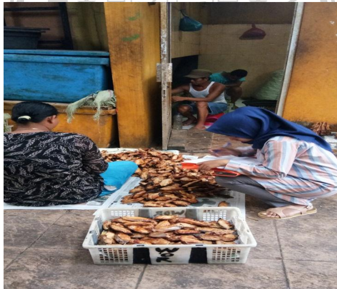
Gambar 5. Ikan Manyung Asap