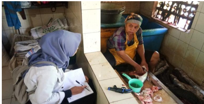
Gambar 4. Proses Penyiangan Ikan Manyung