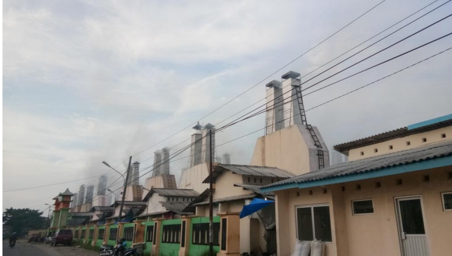
Gambar 1. Kawasan Pengolahan Ikan “Asap Indah” di Desa Wonosari