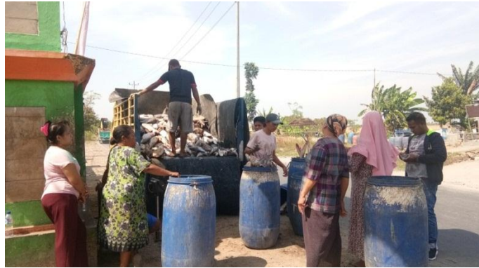
Gambar 3. Bahan Baku Ikan Manyung