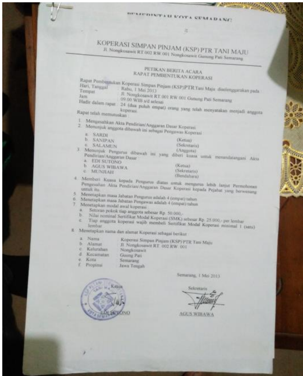
Lampiran 3. Berita Acara Pendirian KPTR Tani Maju