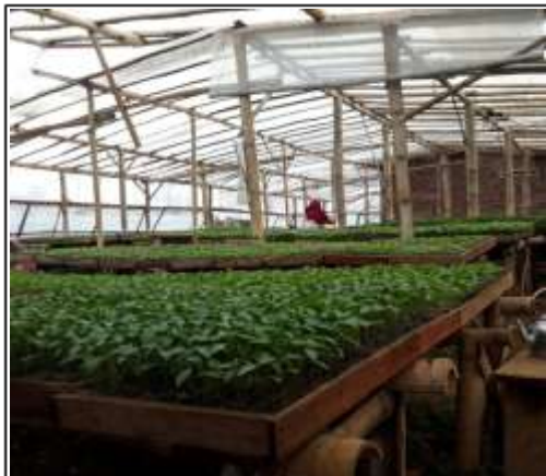
Gambar 5. Benih siap jual