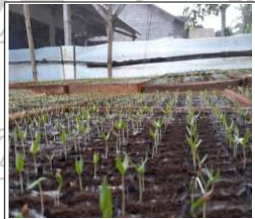
Gambar 4. Benih mulai tumbuh