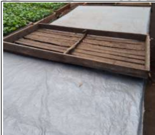
Gambar 3. Penutupan persemaian selama satu minggu