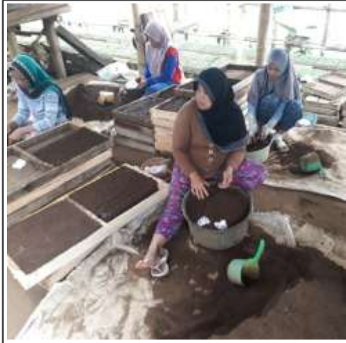
Gambar 1. Proses pencampuran dan pemasukan media