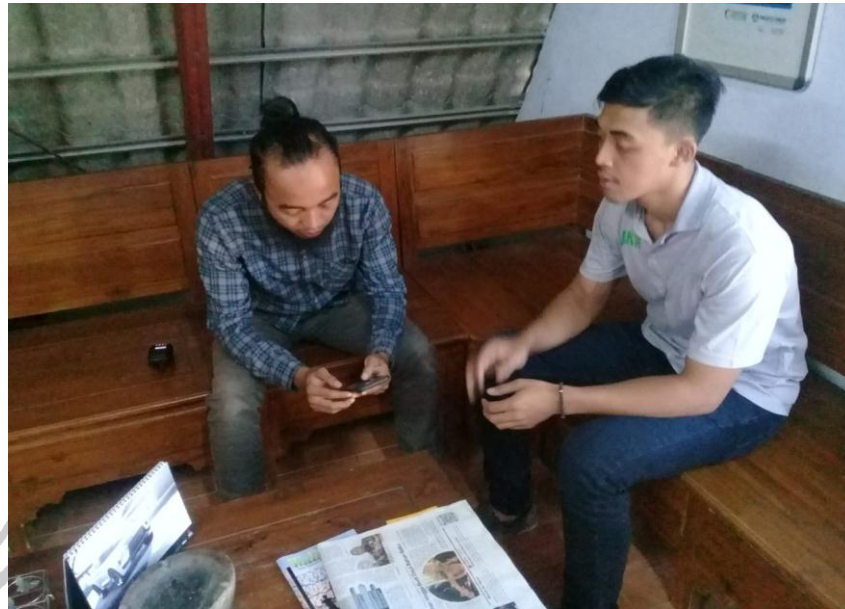
Gambar 1 wawancara