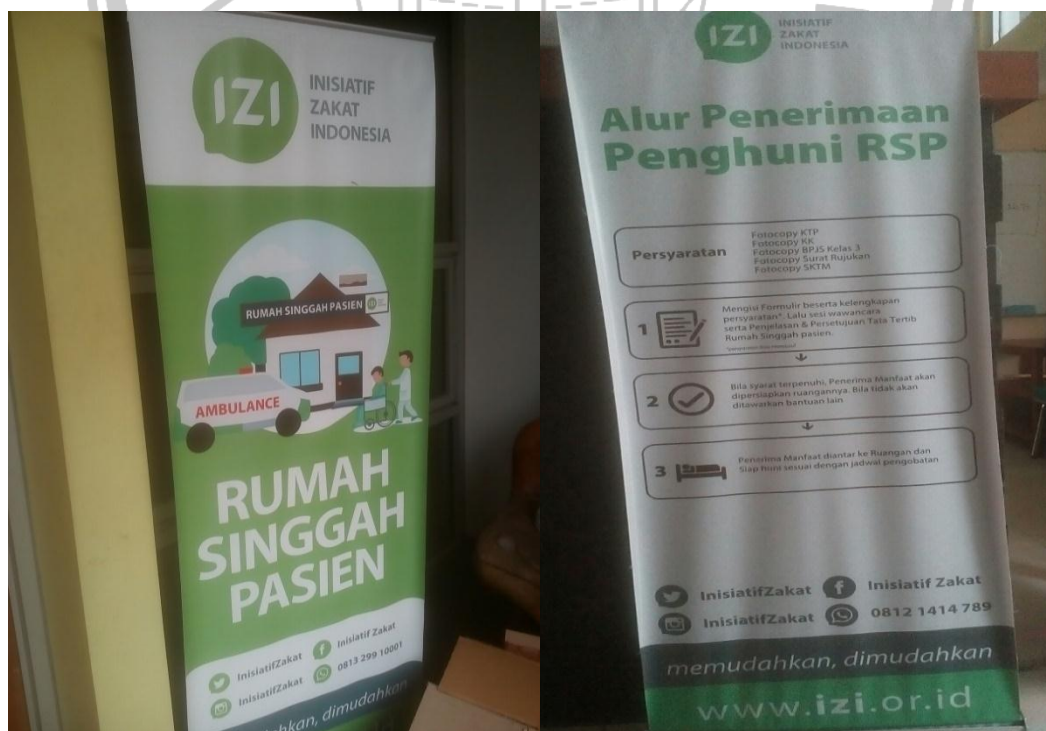
Banner di Rumah Singgah Pasien (RSP) IZI Jawa Tengah