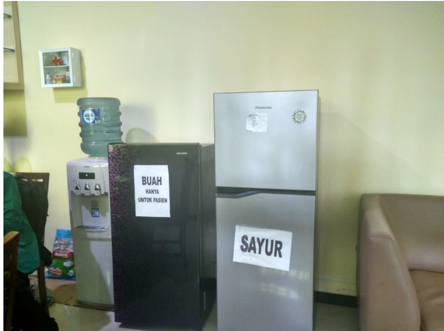
Kulkas untuk tempat persediaan buah dan sayur bagi pasien di RSP IZI Jawa Tengah