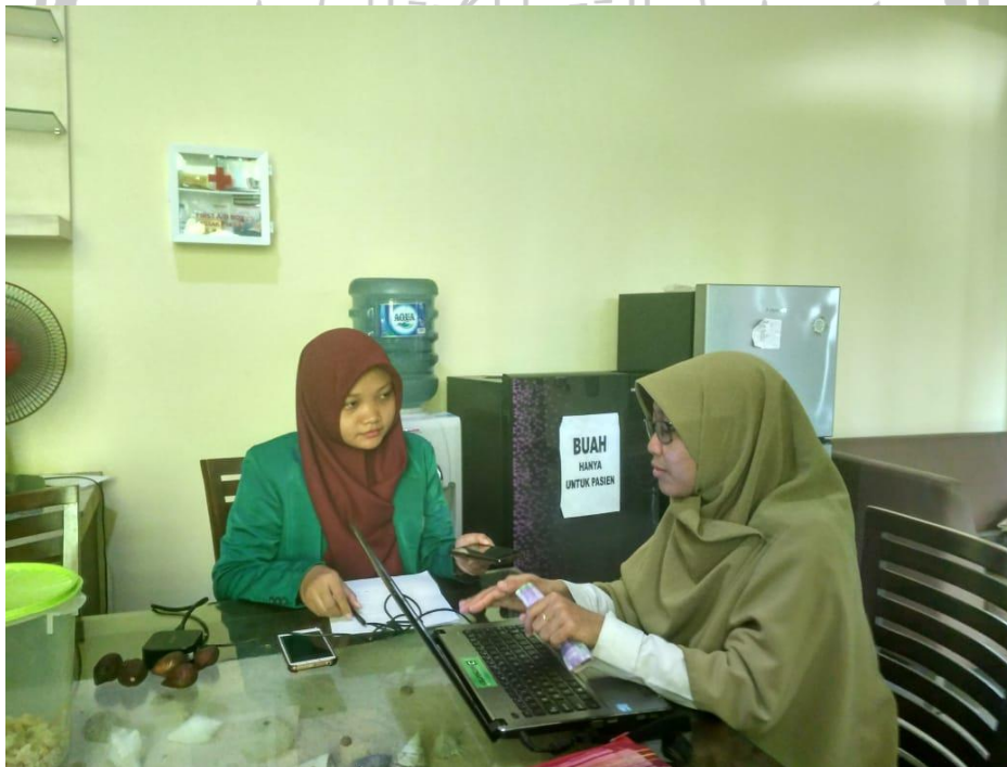
Wawancara Kepala Bidang RSP IZI Jawa Tengah