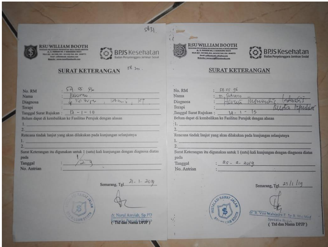
Surat rujukan salah satu pasien di RSP IZI Jawa Tengah