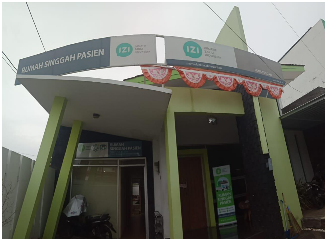
Tampak depan Rumah Singgah Pasien (RSP) IZI Jawa Tengah