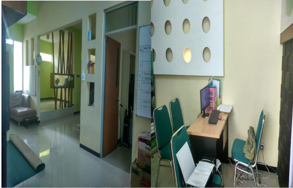
Ruang Tengah RSP IZI