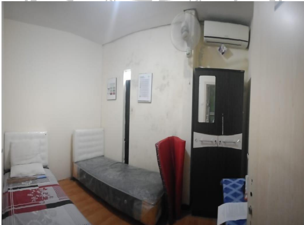
Kamar tidur pasien RSP