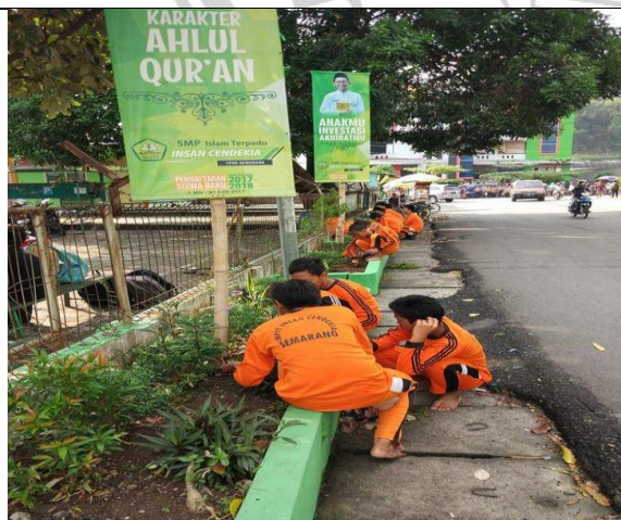
Bersih-bersih lingkungan sekitar sekolah