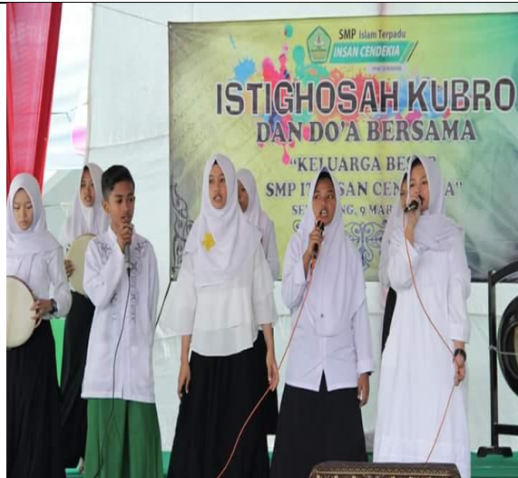
Kegiatan tahunan Istighosah Kubro & Doa bersama