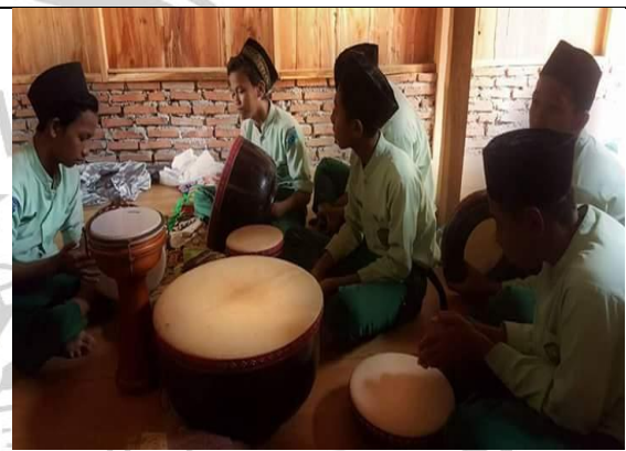
Siswa SMP IT Insan Cendekia sedang berlatih rebana