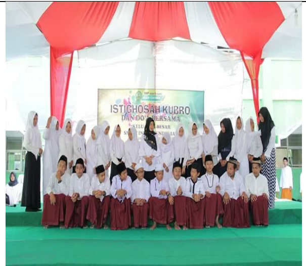
Kegiatan istighosah menjelang UNBK