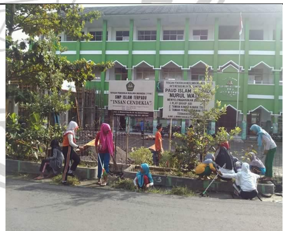
Implementasi nilai karakter peduli lingkungan