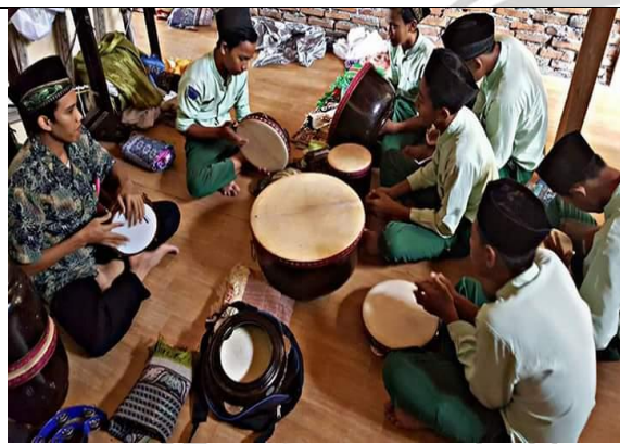
Kegiatan ekstra rebana