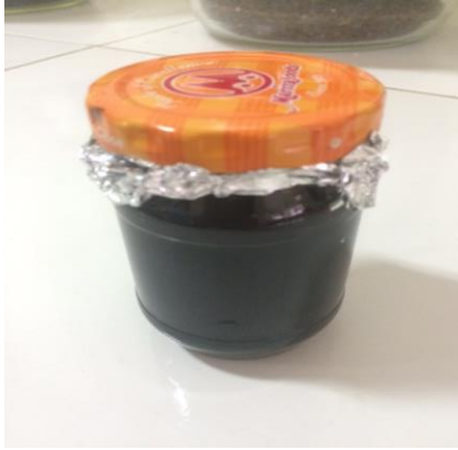
Ekstrak kental daun ubi jalar