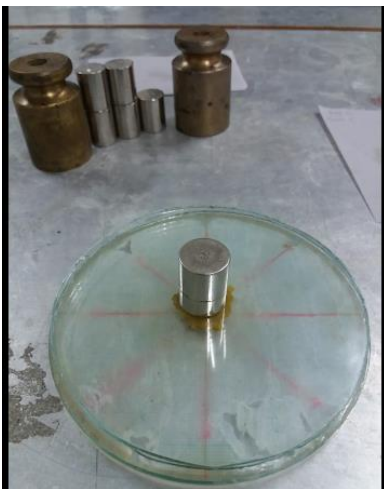
Uji daya sebar salep