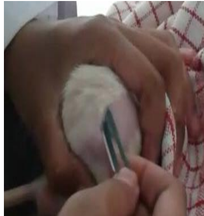
Proses mencukur bulu tikus