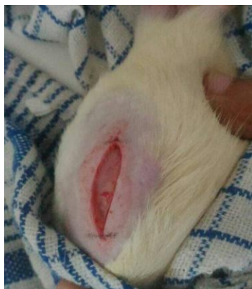
Pembuatan luka sayat pada tikus