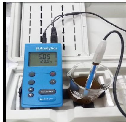
Uji pH salep