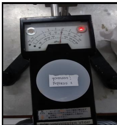
Uji Viskositas salep