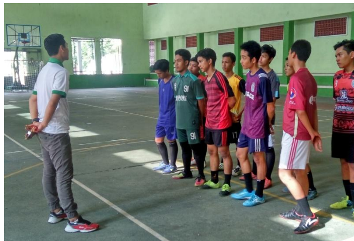
PENJELASAN PERMAINAN SHOOT BALL SKALA BESAR