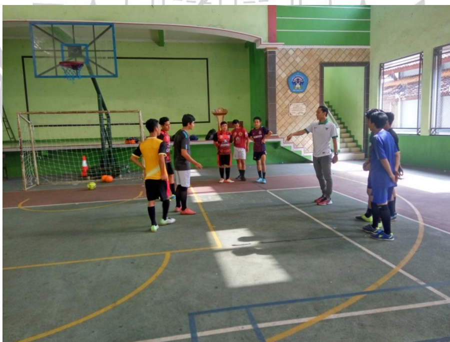
PENJELASAN PERMAINAN SHOOT BALL SKALA KECI