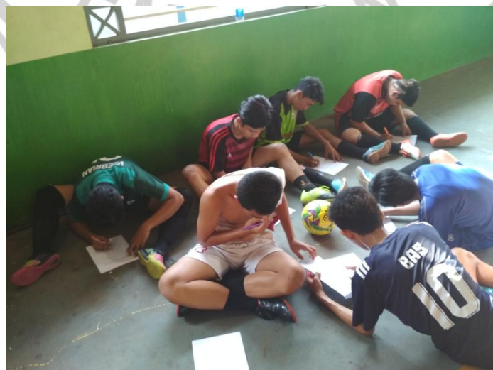
SISWA MENGISI DATA KUISIONER