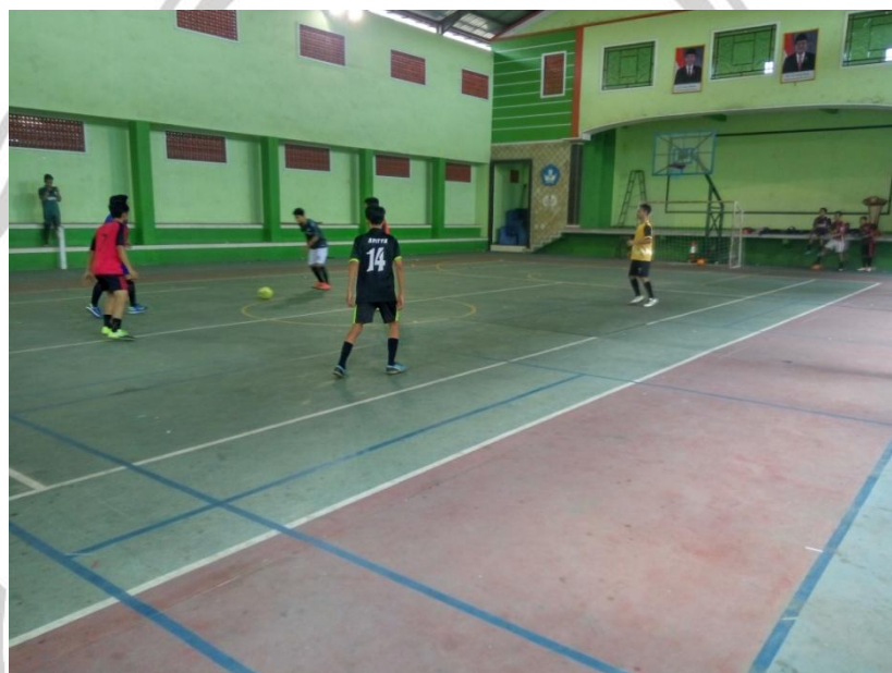
PERMAINAN SHOOT BALL