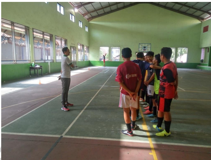
SISWA SMA N 1 PECANGAAN