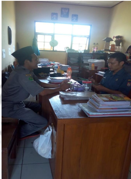
Wawancara dengan Bapak Kepala Madrasah MI NU 47 Cepiring Kendal