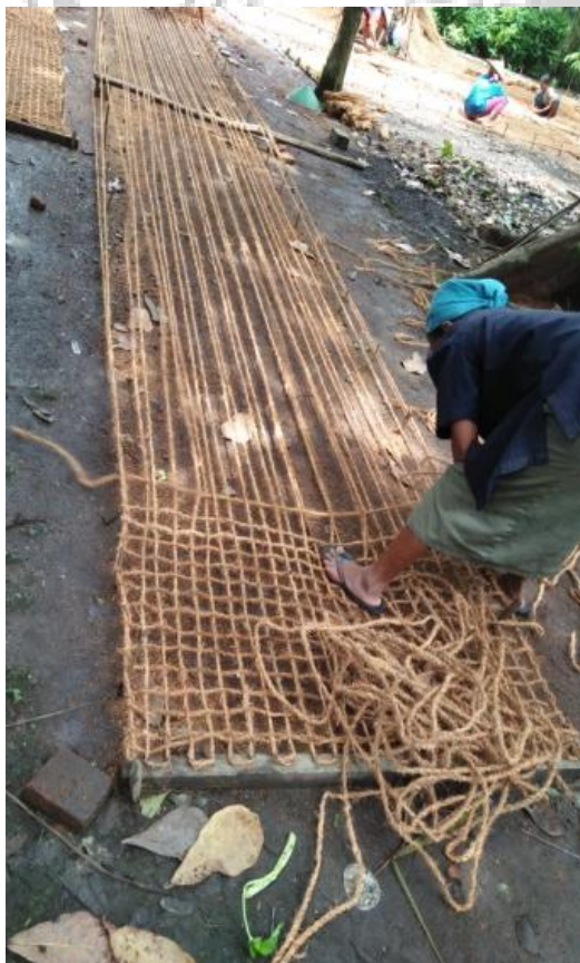
Tahap 3 Cocomesh