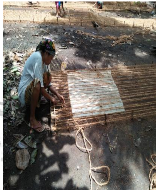
Tahap 2 Cocomesh