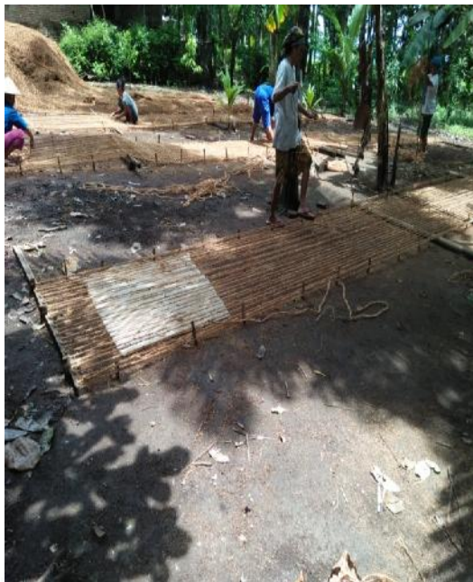
Tahap 1 Cocomesh