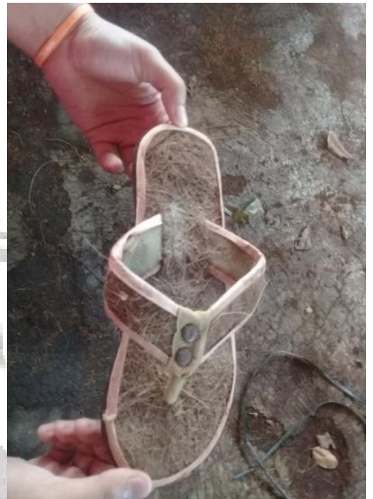
Sandal Sabut Kelapa