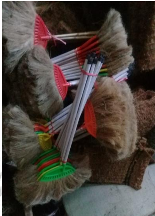
Sapu Sabut Kelapa