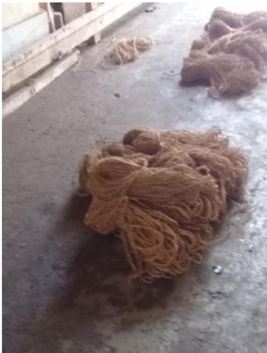
Tali Sabut Kelapa