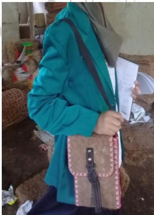
Tas Sabut Kelapa 1