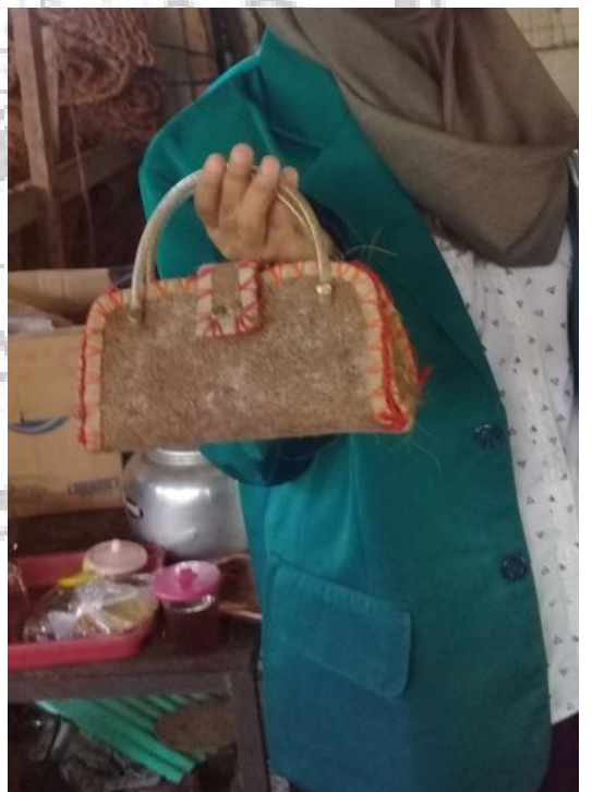
Tas Sabut Kelapa 2