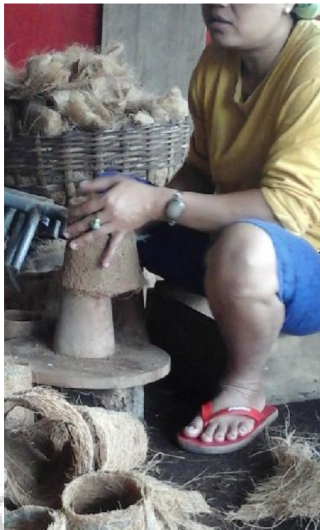
Pencetakan alas pot