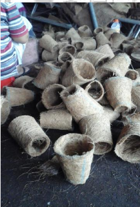
Pot Setengah Jadi