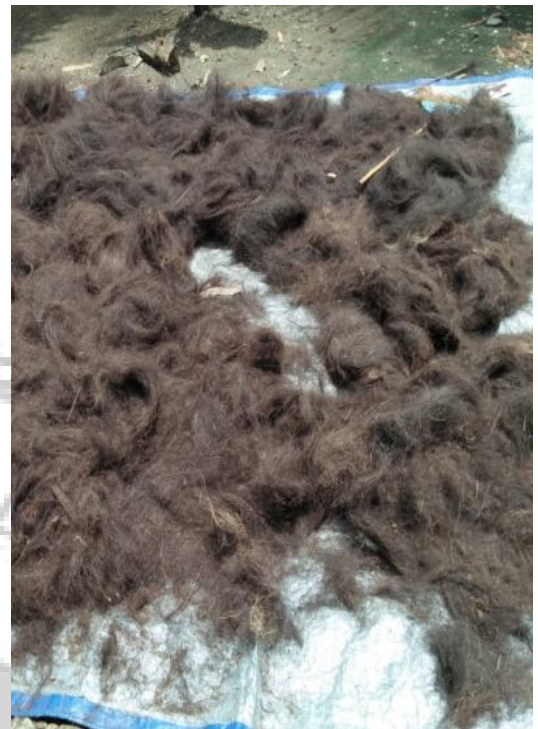
Ijuk untuk Tulisan Kesed