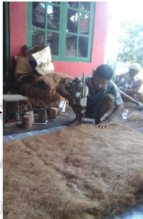
Pemotongan sesuai pola