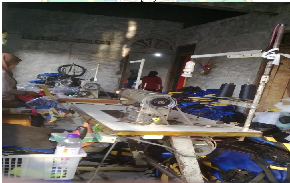
Tempat kerja di HQ Collection