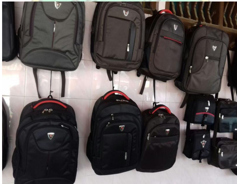
Hasil produksi tas