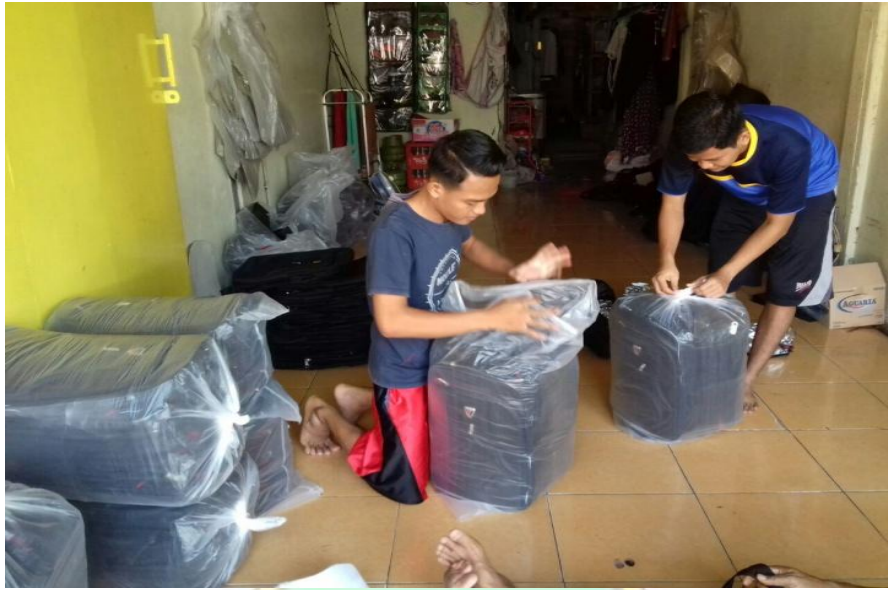
Proses packing tas