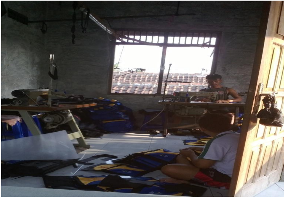
Bagian pembantu proses penjahit ( kenek )