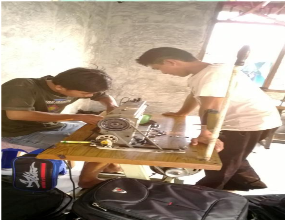
Pembelajaran untuk karyawan baru