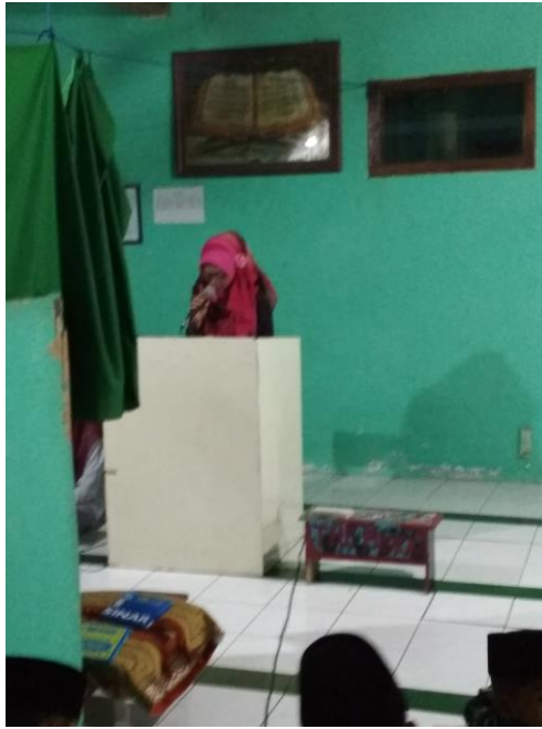
Santri Putri Sedang Praktik Khitobah