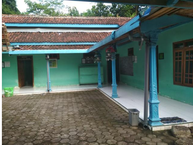
Pondok Pesantren Putra