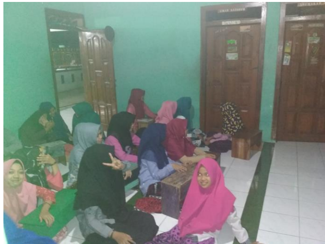
Para Santri Putri sedang mengikuti kegiatan khitobah