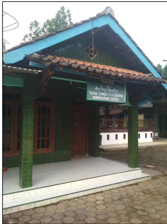
Pondok Pesantren Putri