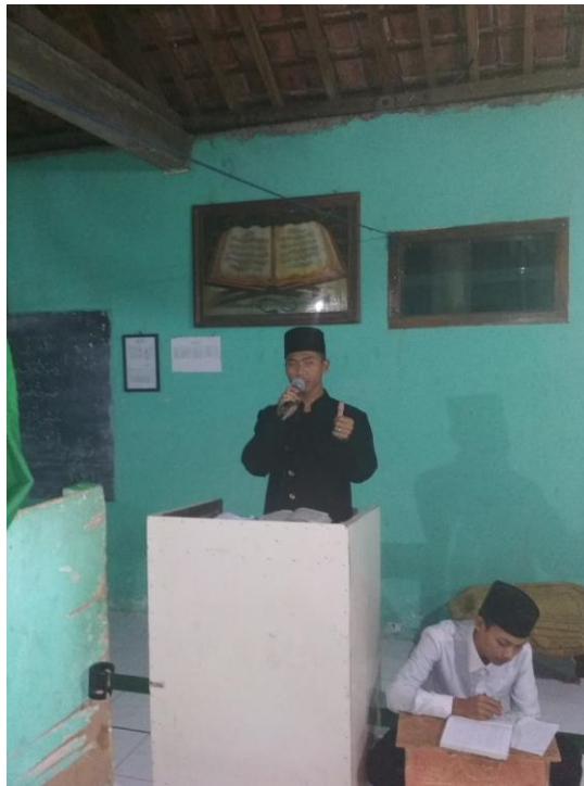
Santri Putra Ketika Sedang Praktik Khitobah