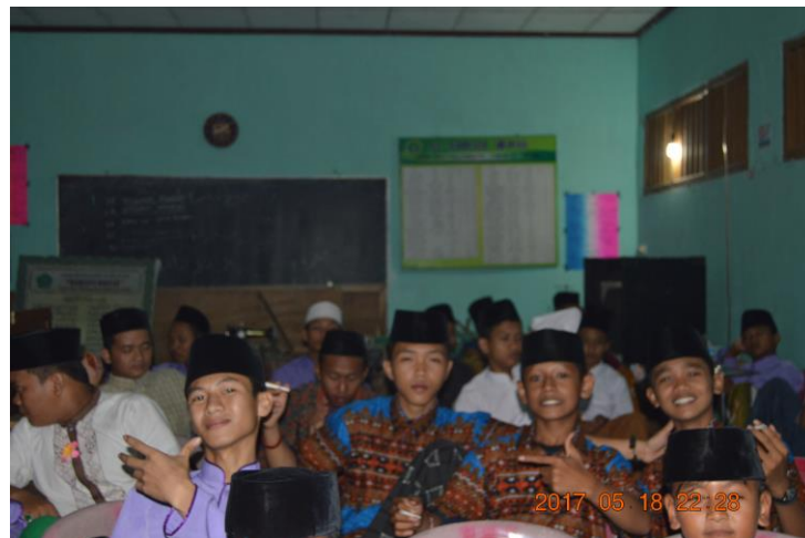
Para Santri Putra sedang mengikuti kegiatan khitobah