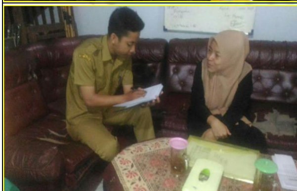
Wawancara dengan Guru PAI