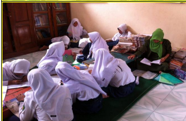
Pembiasaan Membaca di Perpustakaan