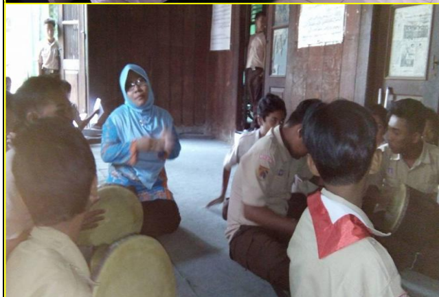
Kegiatan Literasi Sekolah