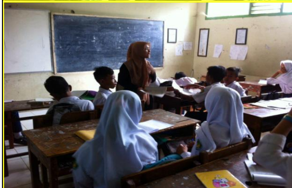
Pembelajaran PAI di Kelas