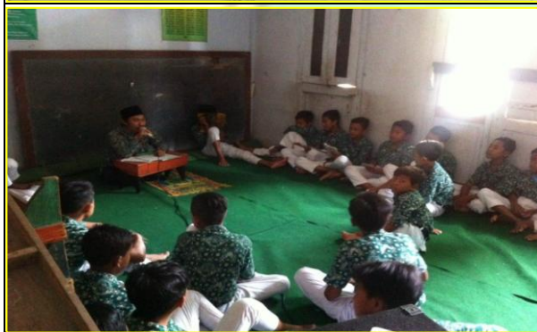
Pembiasaan Pembelajaran Kitab Akhlak setelah Sholat Dhuha