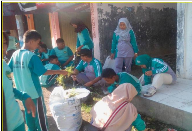
Kegiatan Bakti Sosial Kebersihan Lingkungan