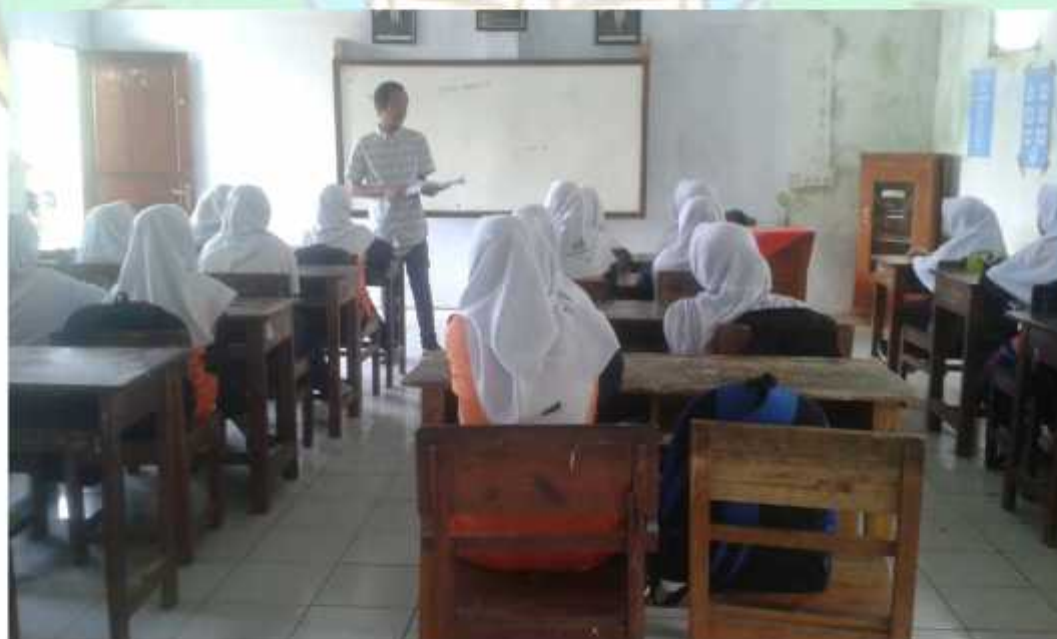
Gambar penjelasan sebelum ambil data/penelitian siswa kelas VII MTs Hasyim Asy'ari Bawang Batang