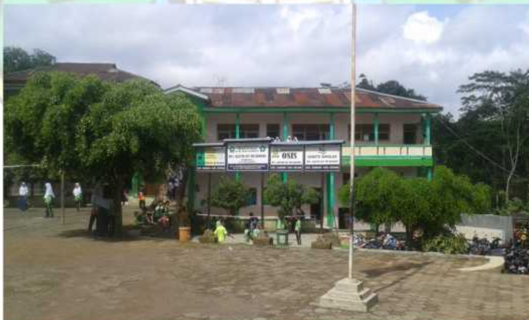
Gambar MTs Hasyim Asy'ari Bawang Batang