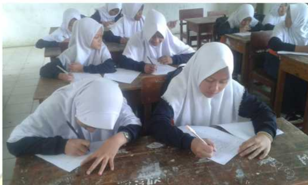
Gambar pelaksanaan pengisian angket penelitian siswa kelas VII MTs Hasyim Asy'ari Bawang Batang