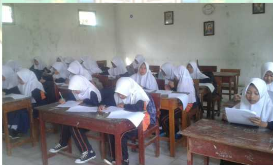
Gambar pelaksanaan pengisian angket penelitian siswa kelas VII MTs Hasyim Asy'ari Bawang Batang