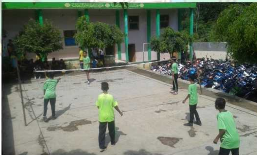
Gambar pembelajaran sepak takraw kelas VII MTs Hasyim Asy'ari Bawang Batang