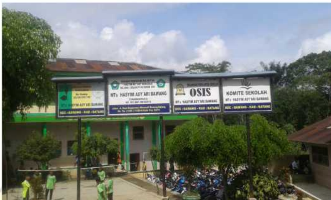
Gambar MTs Hasyim Asy'ari Bawang Batang