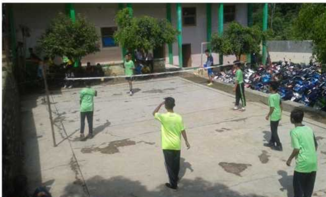
Gambar pembelajaran sepak takraw kelas VII MTs Hasyim Asy'ari Bawang Batang