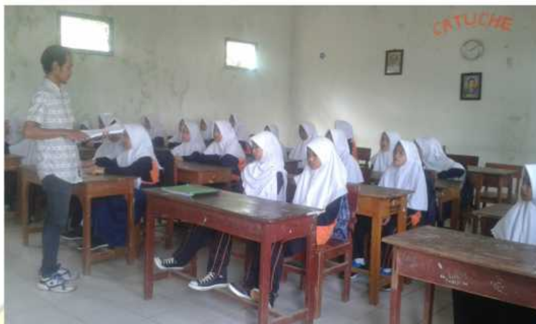
Gambar penjelasan sebelum ambil data/penelitian siswa kelas VII MTs Hasyim Asy'ari Bawang Batang