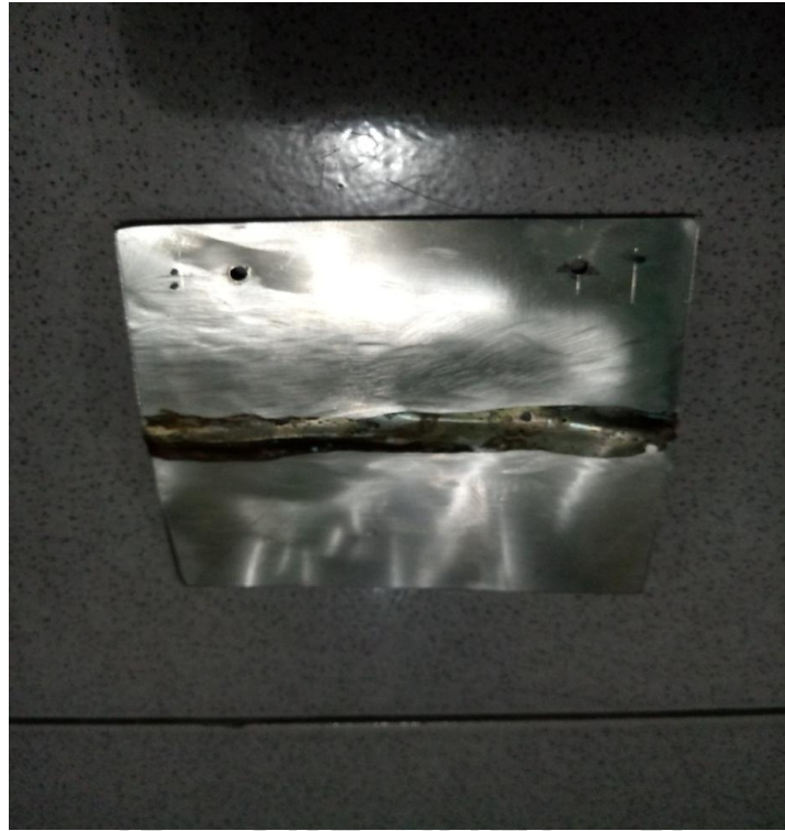
Gambar Spesimen Pengelasan Asitelin Sebelum Pengujian