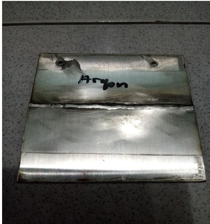
Gambar Spesimen Pengelasan Argon Sebelum Pengujian